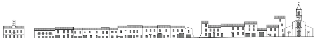
Grand Rue, élévation est