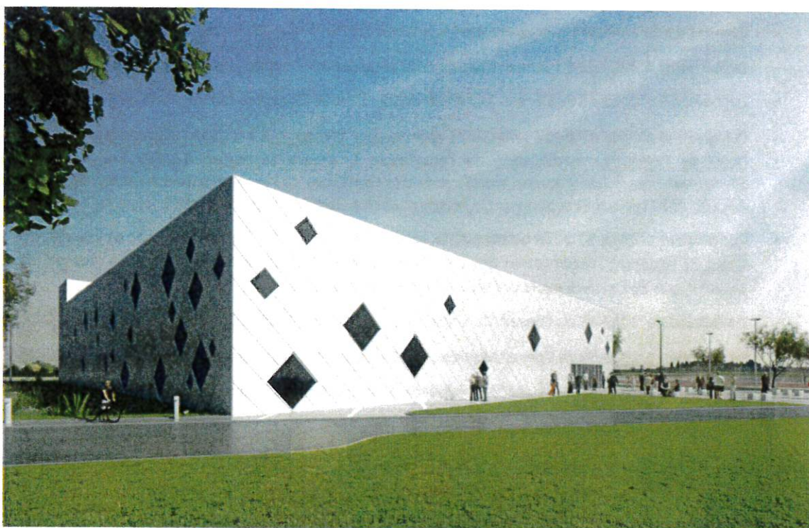
Perspective du projet, vue sur l'entrée et parvis (Chabanne Architecte)

Aussi, par avenant n°1 à la convention de mandat, l'enveloppe financière du Centre Omnisports est désormais arrêtée par la ville, au regard du nouveau coût prévisionnel des travaux, à la somme de 5 201 616 € HT (CINQ MILLIONS DEUX CENT UN MILLE SIX CENT SEIZE EUROS HT) hors rémunération de la SPL Agate.