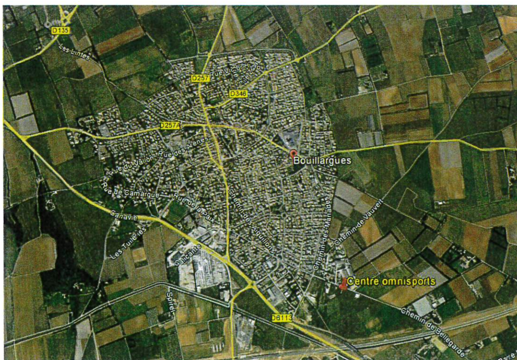
Localisation du futur centre omnisports dans le secteur des Aiguillons

Ce projet se situe à l'entrée sud-est de la commune, dans le secteur dit des Aiguillons.