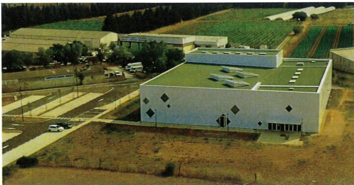
Vue du projet livré